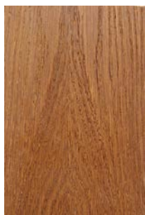
5310 Rovere scuro