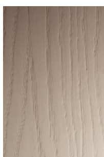
53-5233 Rovere poro aperto