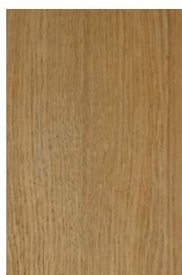
5330 Rovere grigio