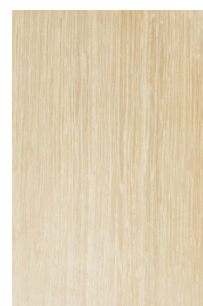
5340 Rovere sbiancato