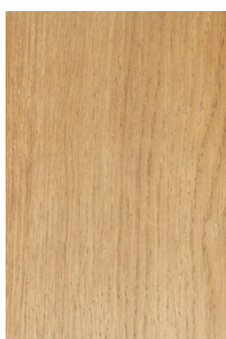
5320 Rovere chiaro